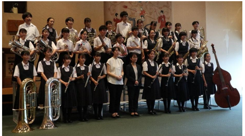
吹奏楽部(コンクール県大会の演奏終了後)

吹奏楽部は、8月2日に吹奏楽コンクール中央地区大会を勝ち抜き、8月9日の県大会でも見事金賞を勝ち取りました。おめでとうございます。この後、9月9日には山梨県で開催される西関東大会での演奏が待っています。吹奏楽部の中央地区大会、県大会と2回演奏を聞きましたが、さらに演奏に磨きがかかってきたと感じました。